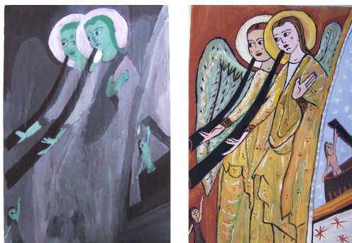
Grisaille Couche peinture à détrempe Travail réalisé par un élève

. Application des techniques picturales des grands maîtres du gotique catalan: Base de couleur, marquer la dessin, dorer et argenter, grisaille, couche de peinture à détrempe. Avec la correspondante application d'empâtements, glacis et raviveurs.